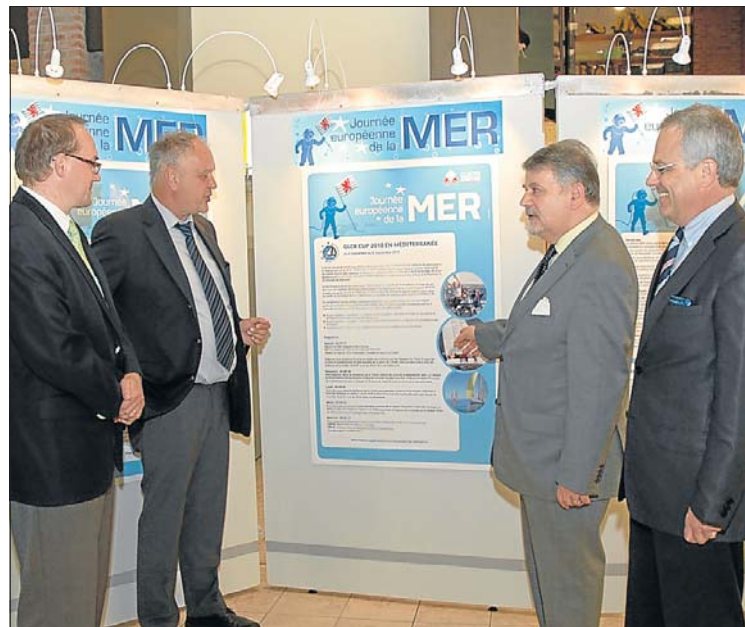
Die dem Meer gewidmete Ausstellung ist noch bis zum 22. Mai im „Shopping Center Belle Etoile“ in Bartringen zu sehen.

Während der Ausstellung wird ein Wettbewerb organisiert, bei dem es eine Kreuzfahrt für zwei Personen an Bord des unter Luxemburger Flagge fahrenden Star Flyer zu gewinnen gibt. (gds)