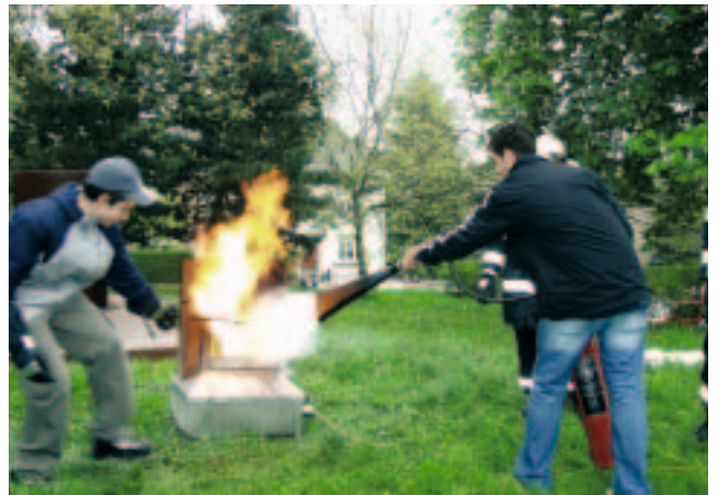
Un grand merci aux pompiers qui ont initié nos élèves à l'extinction d'incendies.