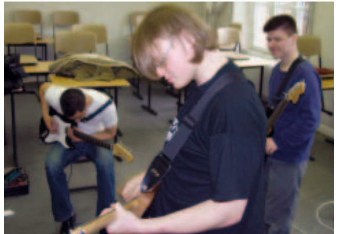
Un échange de savoir-faire musical peu ordinaire.