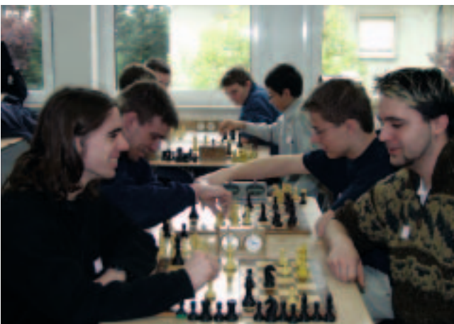
Un air de semi-professionalisme pour des jeunes joueurs d'échecs talentueux ...