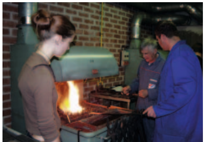
Un bel exemple de l'égalité des chances : la forge au LTAM.