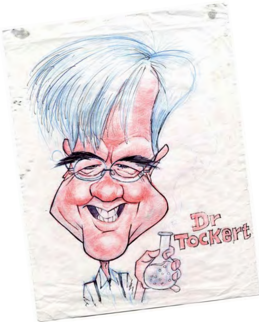
Caricatures par Mohammed Skifati (TSAN)